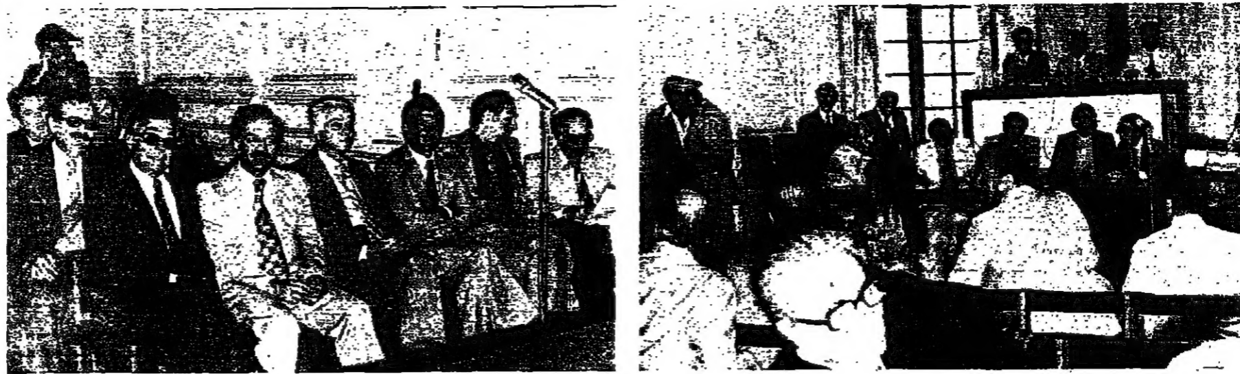
الغروب بانتظار افتتاح الجلسة

تقبل بكل شيء الا موضوع الجنوب الذي لا يختلف عليه اثنان. وسأل لماذا انتقلت المعركة الى الجنوب؟ ان الحرب والمسلم يعرفون ان الجنوب يعتبر دخلاً يستوى اسرائيل، والتوجه عن الجنوب بالرغم من كل الاعتداءات الاسرائيلية، الهدف منه ان يوسع ارضاً فاصلة عازلة كحدود امانة اسرائيل او يفتقها الغزاة.